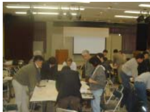
第 1 回ワークショップの様子 様々な意見があがり大変盛り上がりました