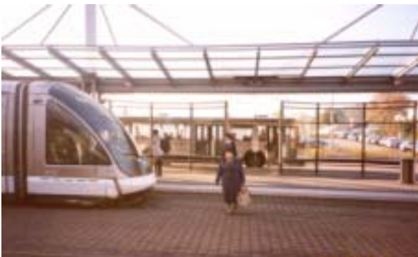
フランス ストラスブールでのバス・自動車から LRT への乗り入れ

今回のワークショップは、枚方市に LRT の導入を検討するにあたり、都市交通体系の見直しと導入に対して問題となってくる「パークアンドライド・料金システム」に繋げるために、第 2 回目として 高齢者と枚方市の交通環境 に視点を置きまして実施します。誰もが移動しやすいまちについて皆さんで討論してみませんか。